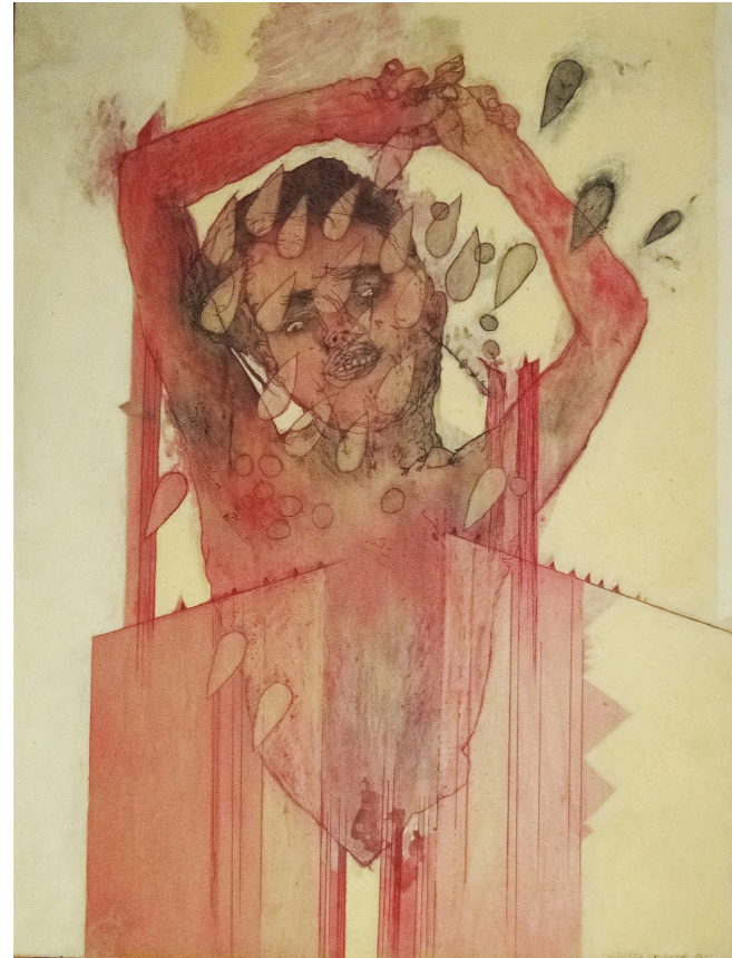
„Део“ (2012), 40x48 cm