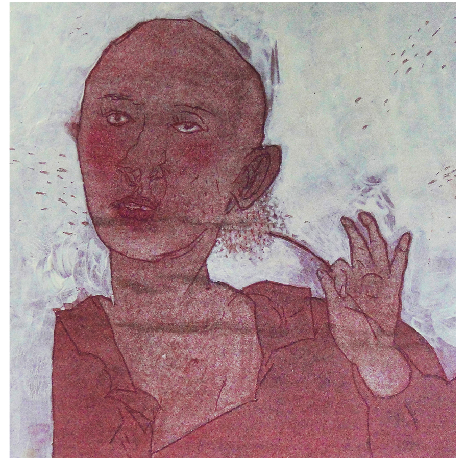
„Маслачак“ (2011), 18x18 cm