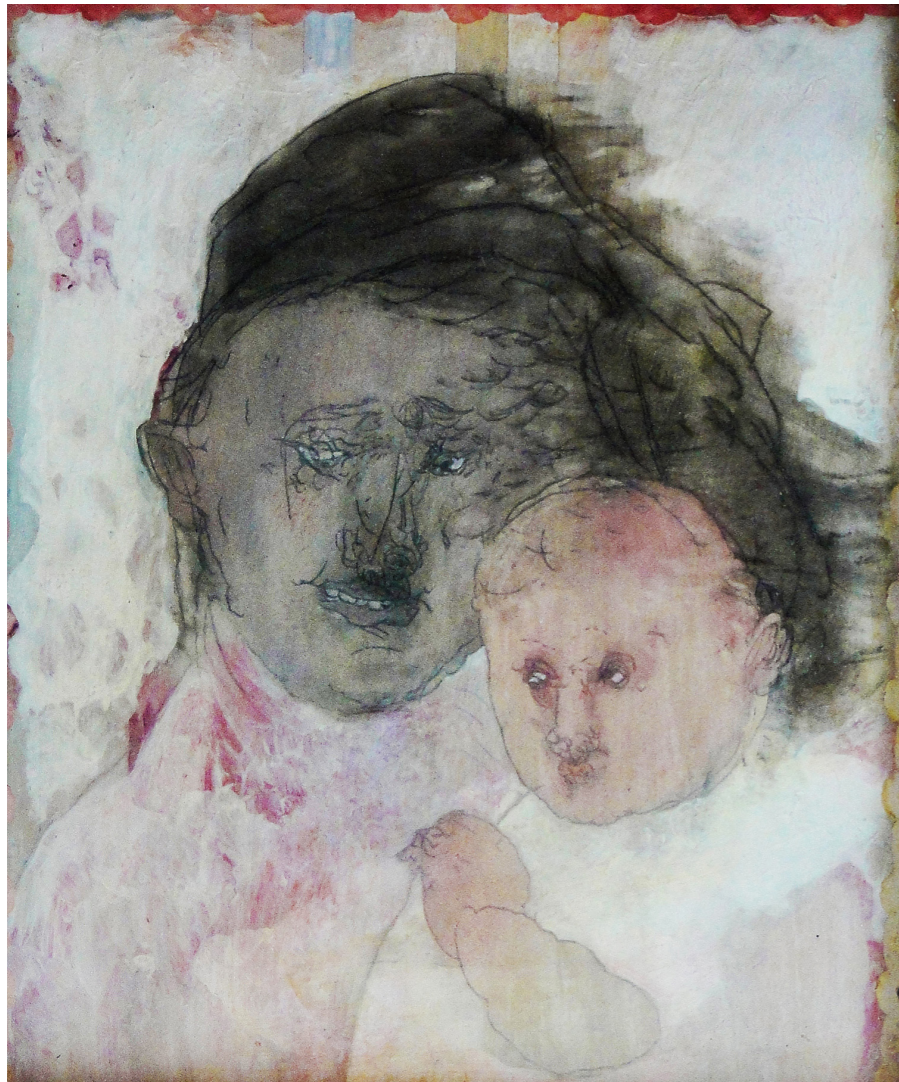
„Без назива“ (2011), 31x35 cm