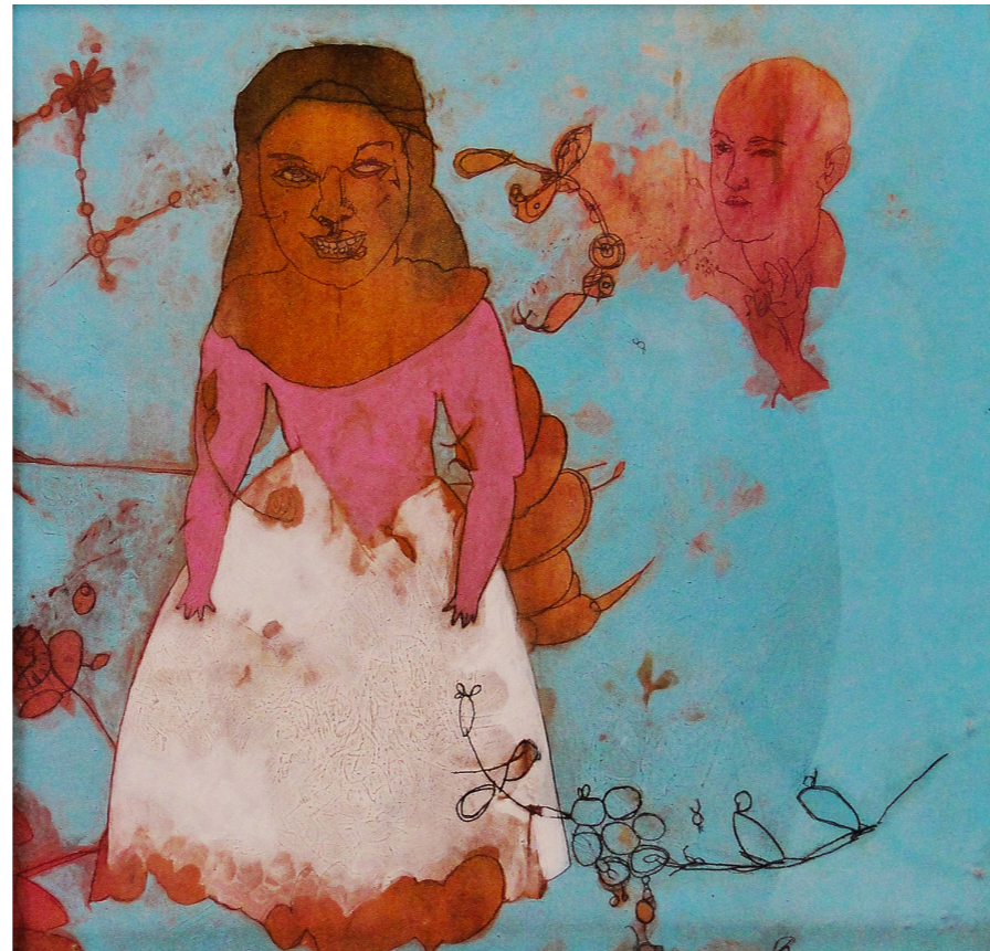
„Невеста“, 37x37 cm