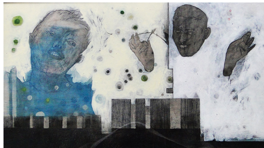
„Помоћ“ (2012), 34x21 cm